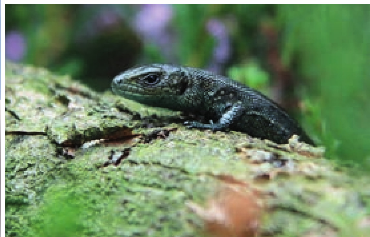
Levendbarende hagedis/Lytse hagedis

Het is moeilijk voor te stellen dat in dit verstilde landschap nog maar enkele weken geleden het geluid overheerste van grote rupskranen die het gebied op de schop namen. Er is in de achterliggende maanden veel werk verzet. Een bijzonder moment was de plaatsing van vier zware betonnen duikers in een gegraven fundering op de bodem van de waterschap-sloot de Nieuwe Maadschutting. De duikers wegen 25.000 kilo per stuk. Voor de beeldvorming: een personenauto weegt ongeveer 1000 kilo. Met een enorme telescoopkraan werden de zware elementen op hun plaats gezet. "Se hawwe in belangrike funksje yn de ferbiningsône, want se soargje derfoar dat it wetter foar de lânbou en it wetter foar it natuergebiet skieden bliuwt. Lânbou en natuer wurkje mei ferskillende wetterpeilen. Oer it generaal hâldt de lânbou in leger wetterpeil oan en yn natuergebieten profitearret de natuer just fan in heger wetterpeil. Der kruse hjir dus twa 'rivieren': ûnder de grûn rint it wetter foar de lânbou en boppe de grûn it wetter foar it Easterskar." Ook is een kade aangelegd die nodig is voor een goed beheer van